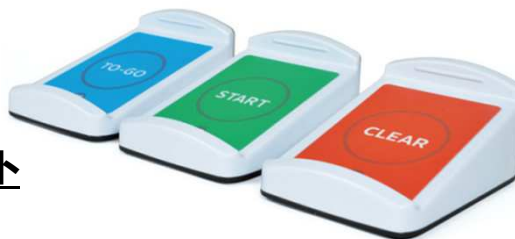
スタート/クリアユニット